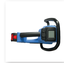
■ Schutzabdeckung für Bedienfeld für zusätzlichen Schutz in rauesten Umgebungen