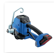
■ Aufhängebügel für stationäre Anwendungen