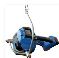
■ Kardanischer Bügel für stationäre Anwendungen