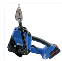
■ Schneller Aufhängeadapter „snap-it“ für stationäre Anwendungen