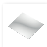
■ 悬挂架 用于在恶劣的环境中进行额外保护