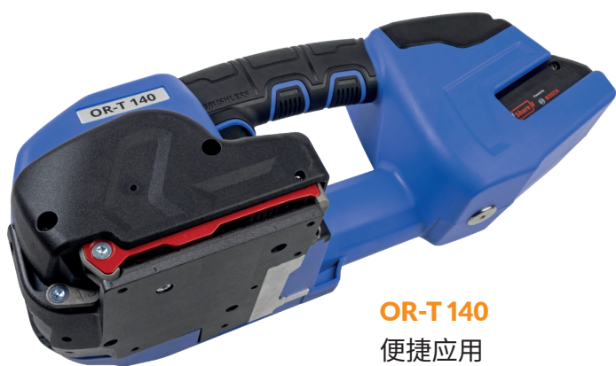
OR-T 140 便捷应用