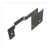
■ 保护底板 用于粗糙表面的捆包物