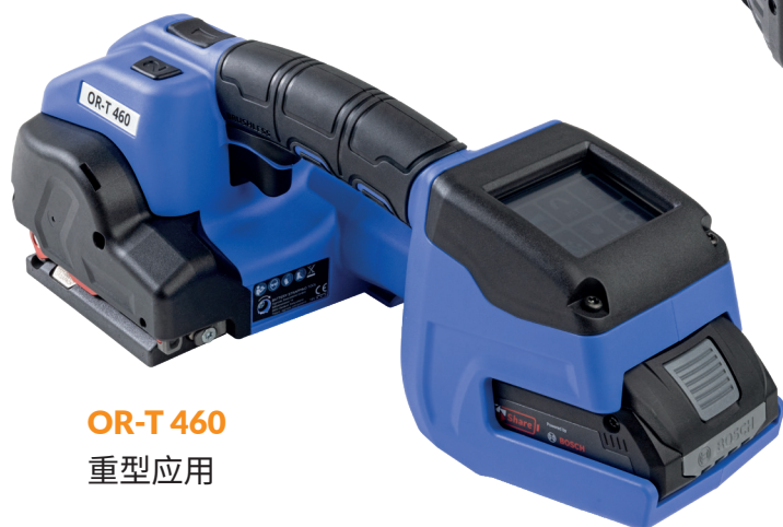
OR-T 460 重型应用