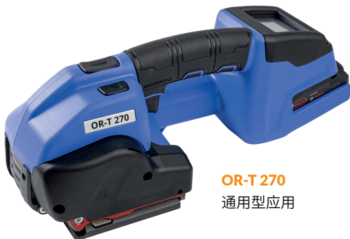
OR-T 270 通用型应用