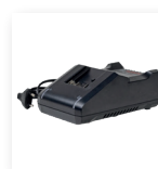
■ 电池充电器 用于安全且稳定的充电