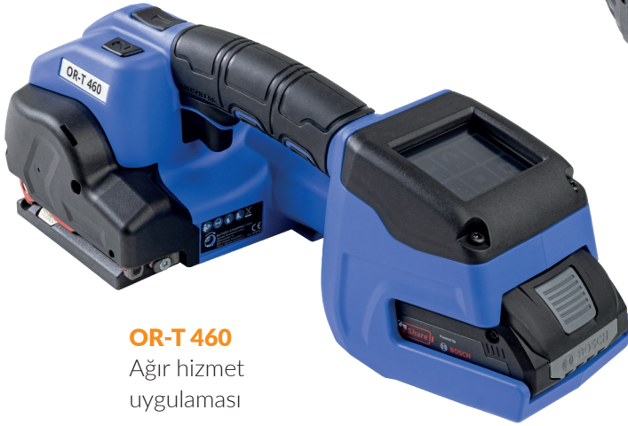
OR-T 460 Ağır hizmet uygulaması