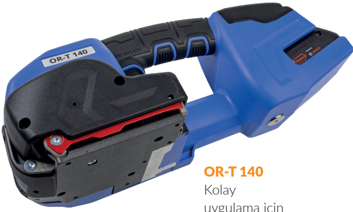
OR-T 140 Kolay uygulama için