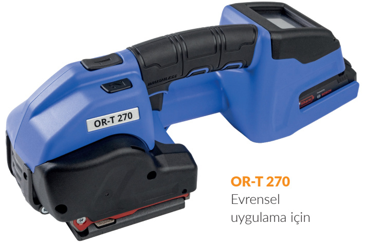
OR-T 270 Evrensel uygulama için